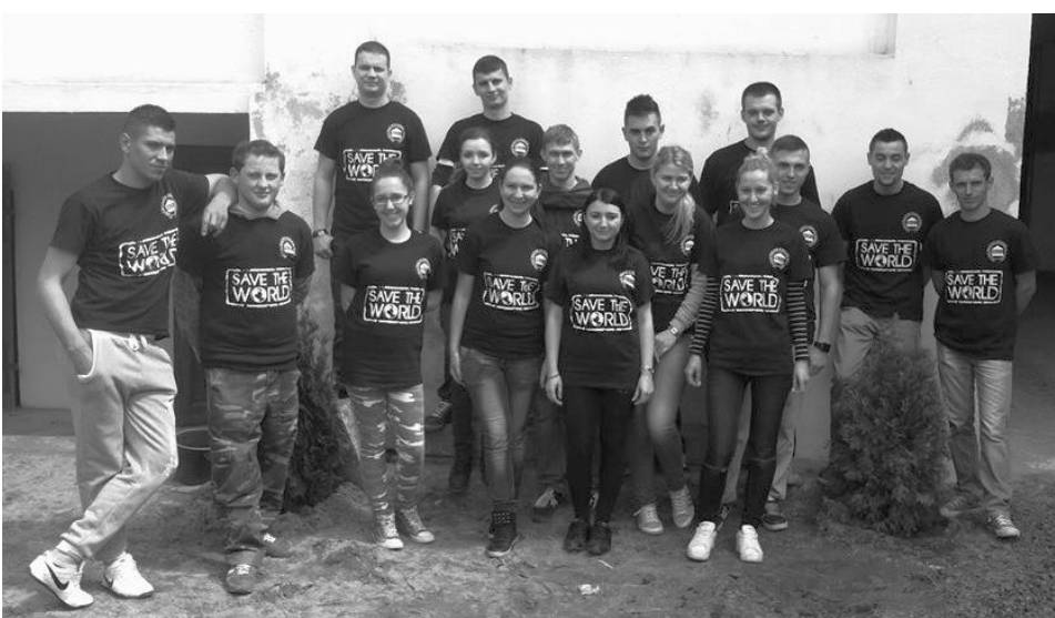
Csoportkép a Föld Napján részt vevő pécskai fiatalokkal

A hagyományoknak megfelelően a pécskai magyar fiatalok idén is megünnepelték a Föld Napját, hogy felhívják a figyelmet, mennyire fontos környezetünk ápolása, megőrzése, bővítése.