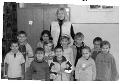
Emlék az első osztályból