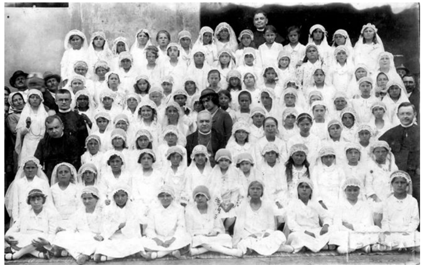
Pécskai elsőáldozók csoportképei 1932. május 16-án