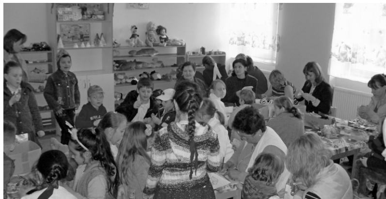
A kicsik és a szülők, nagyszülők kellemes perceket töltöttek együtt

A pécskai RMDSZ Nőszervezete április 12-én, szombaton délután változatos és sokszínű programot valósított meg a Búzavirág Egyesület Boglárka csoportjának társ-szervezésében.