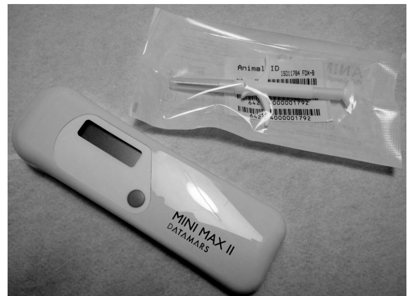
Mikrocsipet beültető fecskendő és leolvasó