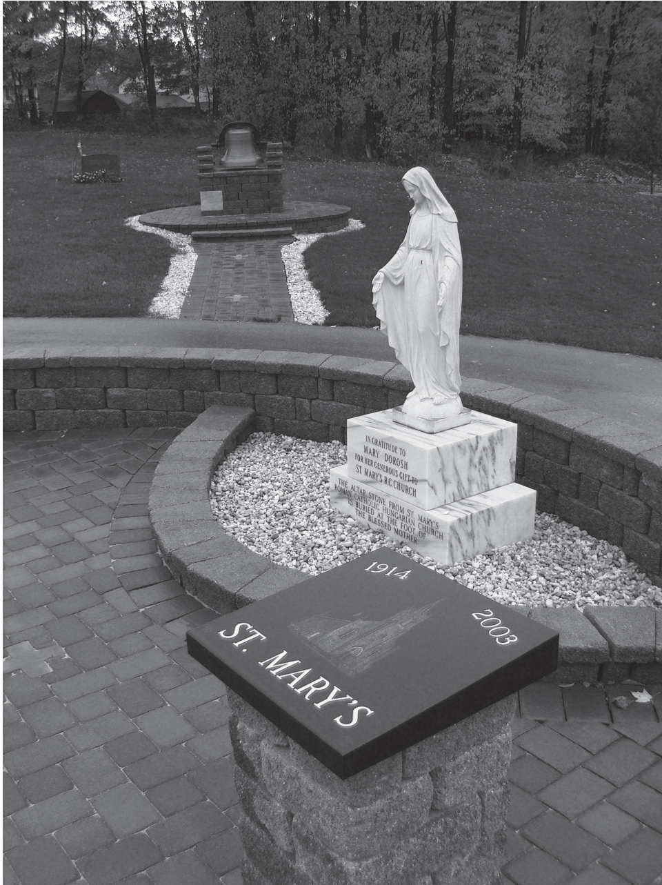
7. kép A 2003-ban lebontott magyar Szűz Mária templom emléktáblája és harangja a magyar temetőben. Windber (PA) 2007.