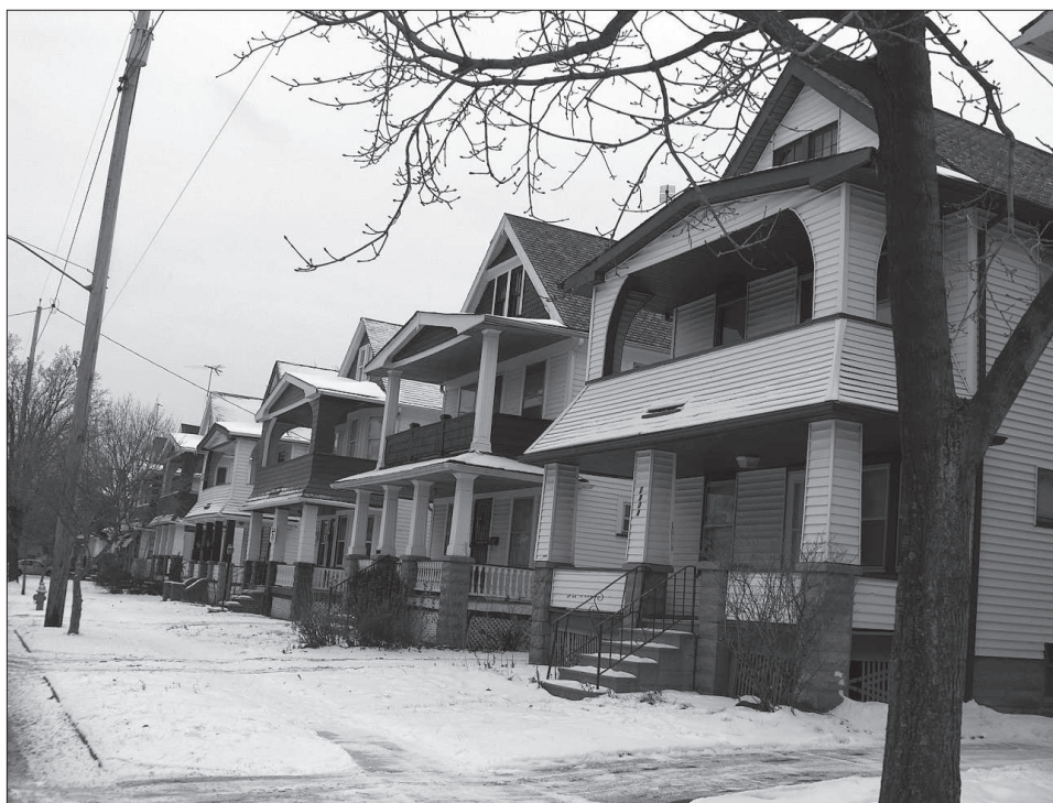
2. kép Az egykori magyar negyed, Buckeye Road környéke. Cleveland (OH) 2009.

azokat – a döntő többségükben politikai okokból – a II. világháborút követően hazájukat elhagyó kivándorlókat jelöli, akik között körülbelül 110 000 magyar is volt. Ez a gyűjtőnévvel „dípíknak” nevezett embertömeg azonban korántsem volt homogén, és az amerikai befogadó közeg is megkülönböztette különböző rétegeit. A Magyarországot 1945-ben elhagyók és az 1947-ben távozók között ellentét feszült: az előbbieket az amerikaiak is az előbbieket inkább háborús bűnösöknek, az utóbbiakat már egy demokratizálódási folyamaton többé-kevésbé átesett, de még az 1948-as kommunista hatalomátvétel előtt távozott csoportnak tekintették (VÁRDY, 2000, 458–462.). A „dípík” zömmel humanitárius értelmiségiek voltak, állami hivatalnokok, diplomaták, csendőrök, katonatisztek, arisztokraták stb., akiknek a tudását kifejezetten nehezen lehetett „konvertálni” az amerikai társadalomba, és jó részük középkorú, tanult és családos ember volt. A tanult, értelmiségi „dípík” nehezen illeszkedtek be a paraszti eredetű, egyszerű „öreg amerikások” környezetébe.