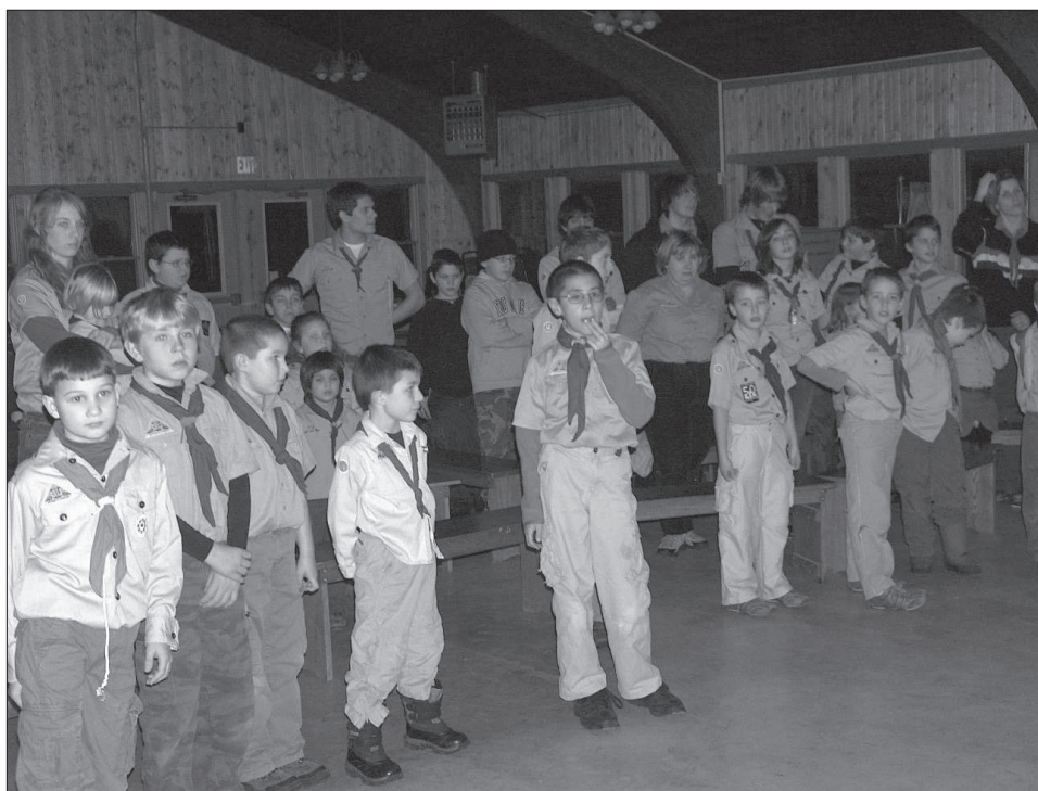
9. kép Cserkészek. Cleveland, 2008.

Sokszor száz mérföldes távolságból jönnek a magyar templomba a magyar családok, viszik hétvégi magyar iskolába, cserkészetre a gyermekeiket, látogatják a magyar kulturális rendezvényeket, megemlékezéseket, ünnepeket. Így váltak „vasárnapi magyarokká” a valamikor sokezres magyar kolóniákban élő magyar közösségek. A rendezvényeknek azért van kiemelten fontos szerepük az amerikai magyar életben, mert ezek maradtak az egyedüli alkalmak, amikor a közösségek az összetartozás élményét megélhetik. Azonban évről évre egyre kevesebb magyar rendezvényt szerveznek. A közösségek szétbomlási folyamata történeti perspektívából természetesnek tekinthető: a munkamigráció miatti szétszóródás, az új generációk nyelv váltása, az intézményhálózat lassú agóniája általános mérföldkövei a beolvadás felé vezető útnak (BALOGH, 2008, 8–13.).