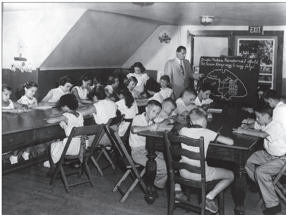
8. kép Magyar iskola Ligonier (OH), 1970-es évek

különbözhetetlen, hogy hírt kapjon róla az ember, felkerüljön levelezési listákra, és ha zártkörű a rendezvény (ilyenek a bálók, például az előzőekben bemutatott Magyar Harcosok Bajtársi Közössége rendezte magyar bál Clevelandban), akkor meghívót is kell szerezni a programra. A templom mint fő szervező erő, a magyar kulturális körök, a magyar iskola (8. kép), a cserkészzet (9. kép) még