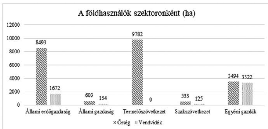
1. ábra Jelentés az Őrség, a Vendvidék és Hegyhát fejlesztéséről, 1971. október.