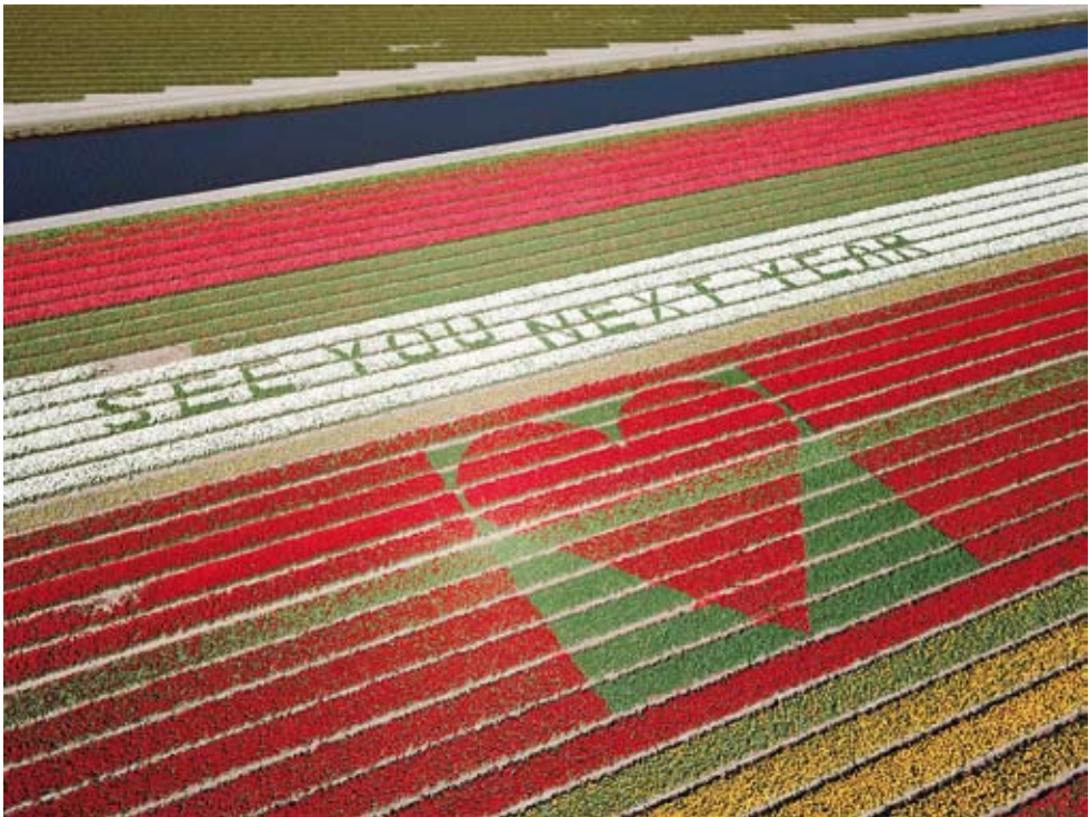
17. kép „Viszlát jövőre” – holland tulipánföldeken kialakított óriásüzenet.