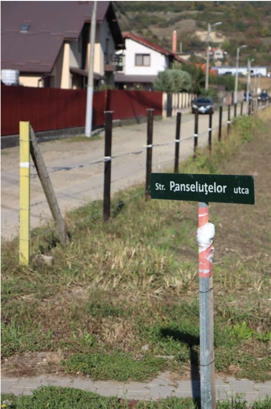
15. kép A járványidőszak alatt nyitott új utcák egyike Udvarfalva és Marosszentanna határában: „Str[ada]. Panseluțelor [= Árvácska] utca”. Fénykép: Nagy Zsolt, 2021