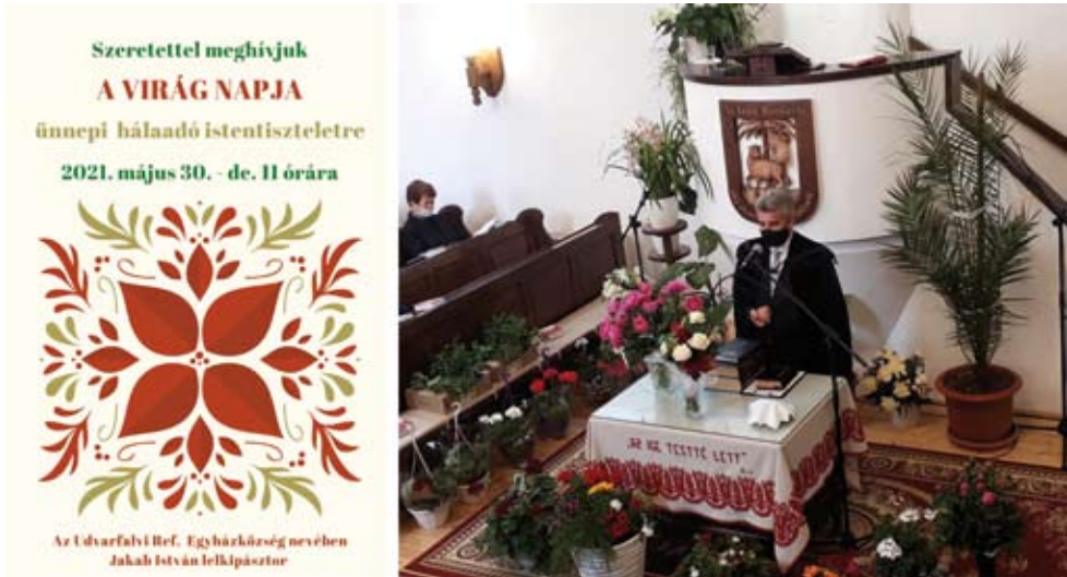
20–21. kép A Virág Napja ünnepi hálaadó istentisztelet Udvarfalván, a világjárvány idején: az esemény plakátja (Nagy Zsolt gyűjtése, 2021) és a virágokkal feldíszített templom.