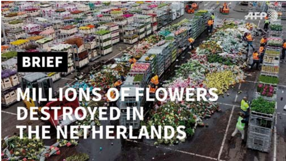
8. kép „Többmillió virág kerül a szemétkbe Hollandiában” – a világsajtót bejáró megdöbbentő képsorok egyike 2020. március 20-án (az AFP News Agency felvétele). Forrás: https://www.youtube.com/watch?v=ZesOc_-JKR4&ab_channel=AFPNewsAgency (letöltés ideje: 2023. június 4.)