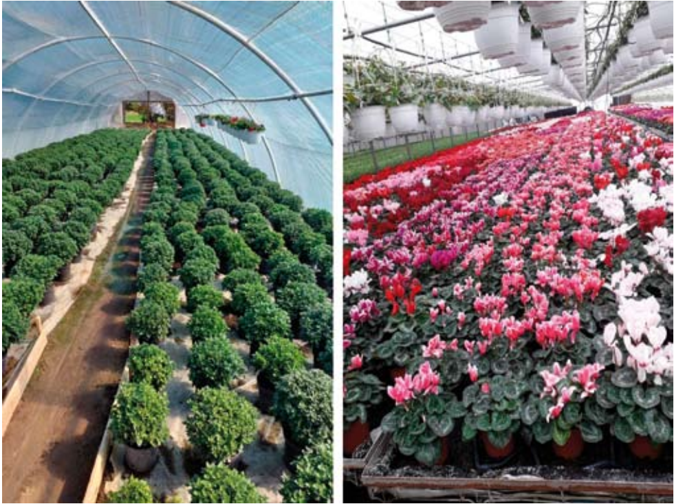
1–2. kép Félintenzív és intenzív fóliasátras kis- és nagyüzemi virágtermesztés Udvarfalván.