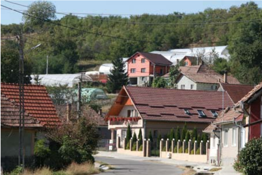
6. kép Dísznövénytermesztést szolgáló fóliasátrak az egykori – filoxéra által kipusztított – szőlőültetőkön, Udvarfalva határában (ma Várhegy részeként). Fénykép: Nagy Zsolt, 2019