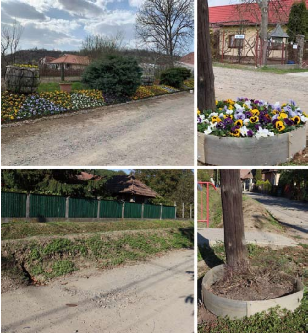
11–14. kép Utcaképváltozások Udvarfalván a karantén időszakában (megjelennek a dísznövények) és a járványügyi korlátozások végén (ismét eltűnnek a dísznövények).

Fényképek: Páll Enikő és Nagy Zsolt, 2020 és 2021