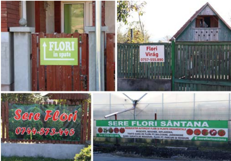
23–26. kép A potenciális nagybani vásárlóknak ( angrósoknak ) eladó dísznövényt jelző táblák, molinók, bannerek („Virágok hátul”, „Virágházak”, „Engedéllyel rendelkező virág- és dísznövénytermelő” stb.).