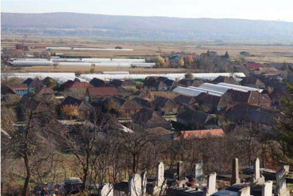
4. kép Dísznövénytermesztést szolgáló szolárok, szérák látványa Udvarfalván, a település fölé emelkedő temetőkerthi dombtól nézve (háttérben a Maros árterülete).