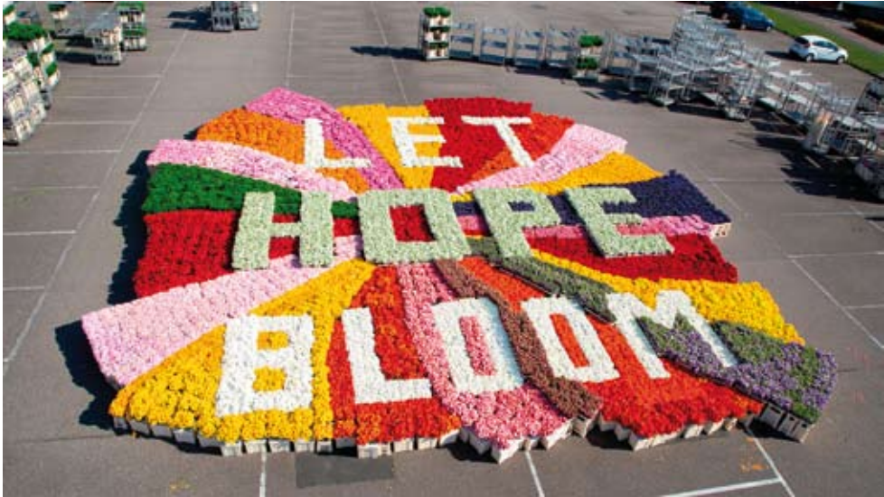
18. kép „Engedd a reményt virágozni” – dísznövényekből kialakított óriásüzenet az Egyesült Királyságban. Forrás: https://www.flowercouncil.co.uk/sites/default/files/bbh_let_hope_bloom_mainkv_horizontaal_1.jpg (letöltés ideje: 2023. június 4.)