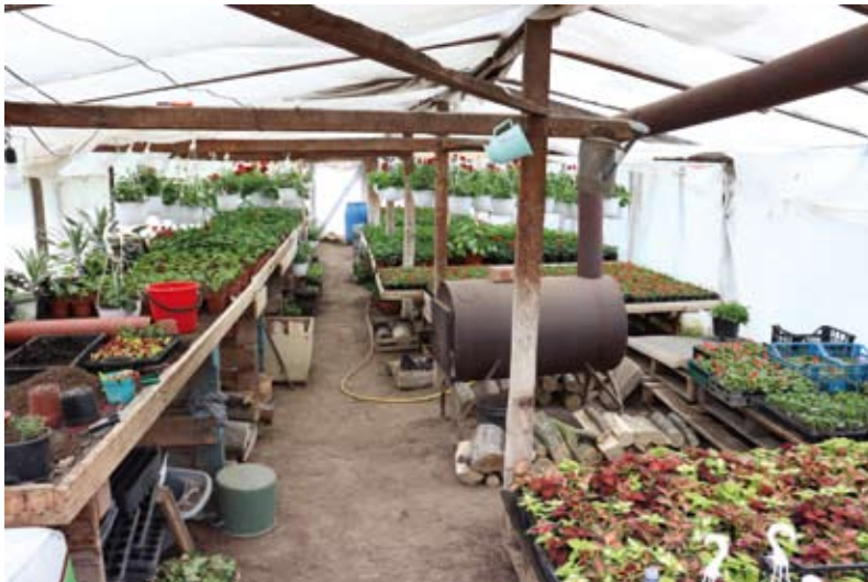
3. kép Kiskerti fűtött fóliás virágtermesztés Udvarfalván. Fénykép: Nagy Zsolt, 2021