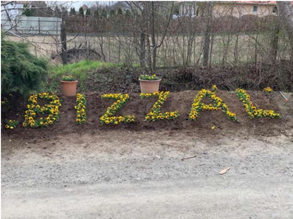
19. kép „Bizzál” – árvácskából ültetett üzenet Udvarfalván, a Szőlő utcában (strada Viilor) a karantén idején. Fénykép: Páll Enikő, 2020