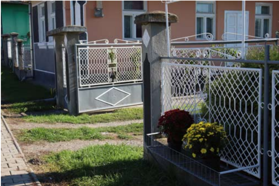
22. kép A potenciális nagybani vásárlóknak (angrósoknak) eladó dísznövényt jelző nyitott kapu és kerítés mellé helyezett növény.