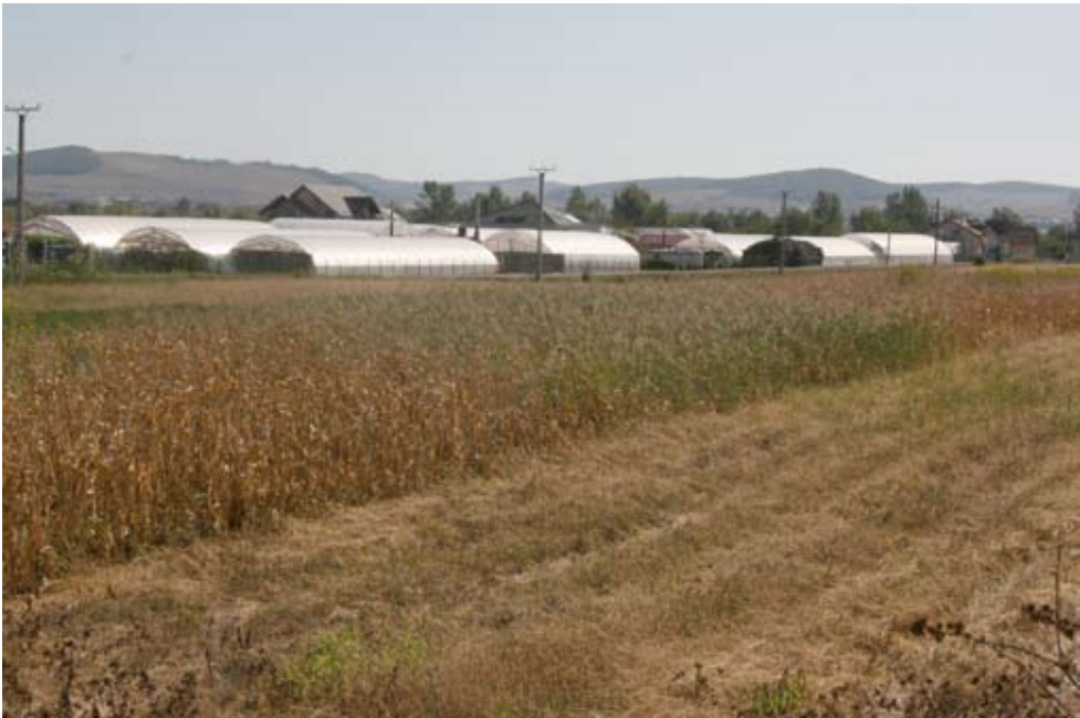
5. kép Dísznövénytermesztést szolgáló fóliasátrak a Maros árterületén, Udvarfalva határában.