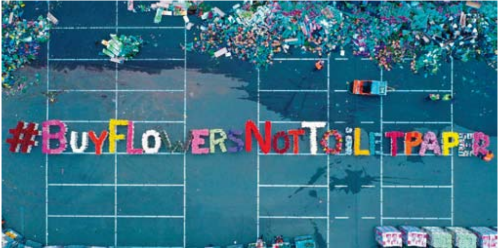
16. kép „Virágot vásárolj, ne vécépapírt” – a holland virágtőzsdén tulipánokból kialakított óriásüzenet.