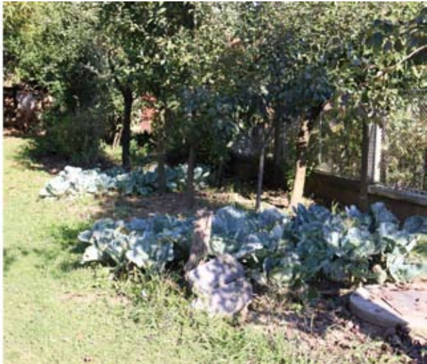
9–10. kép Hagyományos, általános utcakép Udvarfalván: dísznövények hiánya, fiatal gyümölcsfák és zöldséges ágyások a járdák mentén. Fényképek: Nagy Zsolt, 2021